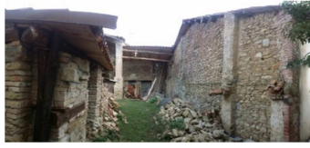
puntellatura e messa in sicurezza del terremoto del 2009