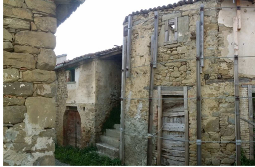
Cerchiature con strutture metalliche, puntellatura in legno, cerchiature con travetti in legno e tiranti o con ponteggi